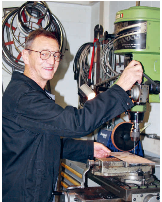
Von der Arbeit in den Werkstätten und der Bildung profitieren

Ich habe meiner RAV-Beraterin gesagt, dass ich hierher will, weil ich schon früher hier war und es hat mir immer gut gefallen. Jedes Mal, wenn ich hier war, hatte ich einen Job gefunden. Ausserdem erhält man Unterstützung bei den Bewerbungen. Ich bin mich gewohnt zu arbeiten und ich mag den Kontakt zu den anderen Teilnehmerinnen und Teilnehmern hier. Das hat mir gefehlt während der Krankheit, da war ich viel alleine zuhause. Nun bin ich zuversichtlich, wieder Arbeit zu finden. Wenn man gesund ist, kann man alles machen!