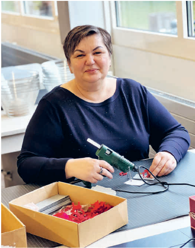
Im Papieratelier filigrane Arbeiten ausführen