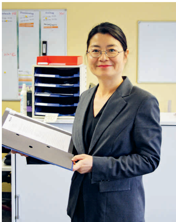
Am Empfang für Kundschaft und Teilnehmende da sein