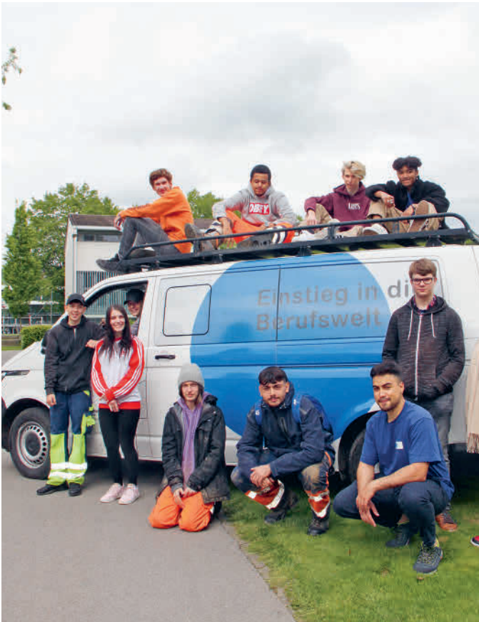
Einstieg in die Berufswelt – Programm 28-2020

Trotz erschwerten Bedingungen konnten Teilnehmende, die bis zum Schluss mitzogen, eine passende Anschlusslösung realisieren.