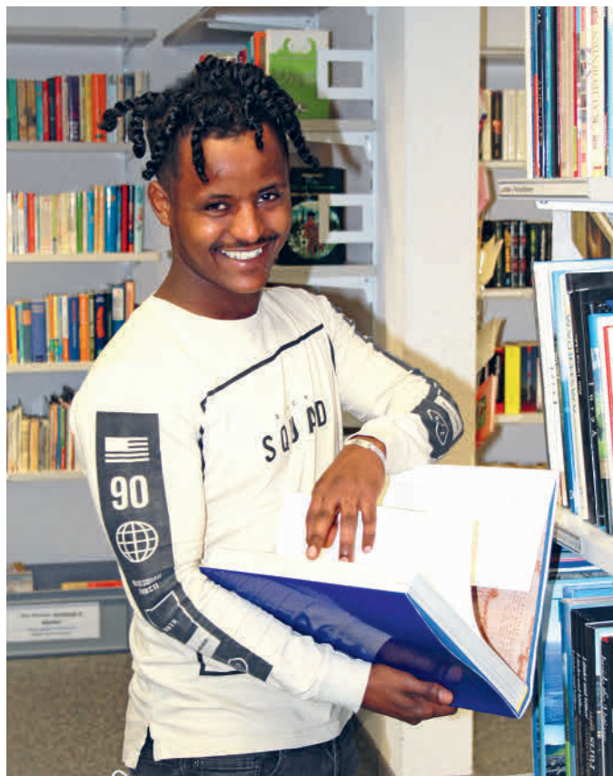
Die Bibliothek für Kundschaft auf Vordermann bringen

Ich habe zuletzt in der Uhren- und Schmuckbranche im Verkauf gearbeitet und chinesische Touristen betreut. Wegen der Pandemie fielen diese aus und ich hatte meine Arbeit verloren. In dieser Branche sind etwa 50 % des Geschäfts auf asiatische Besuchende fokussiert. Auf einmal waren alle weg! Die freie Zeit habe ich genutzt, um den Lehrgang «Sachbearbeiterin Rechnungswesen» abzuschliessen. Ich wollte das System in der Schweiz besser kennen lernen, weil ich Mühe hatte, meine Steuererklärung zu verstehen. Was ich jetzt tue: «Jetzt bin ich froh, dass ich in der HALLE 44 mein Deutsch sowie meine EDV-Kenntnisse verbessern kann. Mit besseren Sprachkenntnissen gelingt die Integration in der Gesellschaft wesentlich besser.